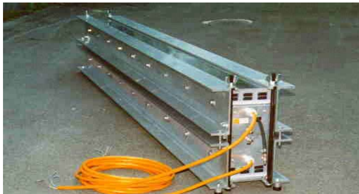
Zur Thermoverschweißung von PVC/PU - Bändern bis 4.000 mm Breite